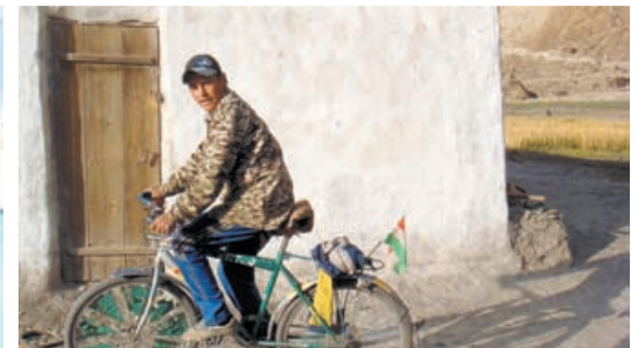
BILDER D. TRUONG

ten nach einem Platz zum Schlafen und baten um eine Mahlzeit. Wir wurden von den warmherzigen Pamiris immer sehr gastfreundlich willkommen geheissen. Wir assen auf dem Boden sitzend die gleichen Lebensmittel wie die Einheimischen: Brot, Tee, getrocknete Früchte, Milchprodukte und bei Gelegenheiten auch mal Fleisch. Es gibt hier im abgelegenen, hohen Pamirgebirge nämlich keine Gasthäuser oder Läden.