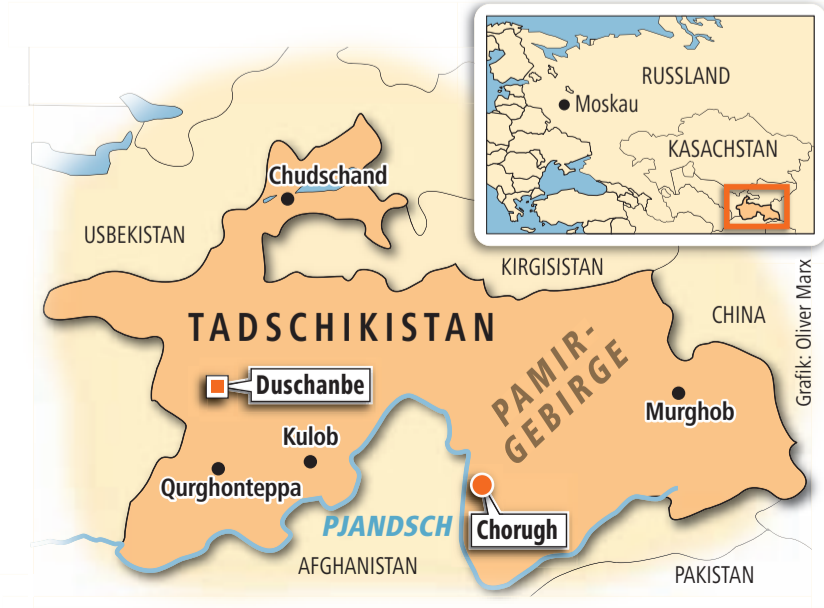
Grafik: Oliver Marx

Wanderwege gibt es kaum. Einige Strässchen vorbei an gefährlichen Abgründen sind sehr eng. Zum Glück waren wir mit unserem kundigen Fahrer Kuban unterwegs. Er steuerte uns sicher über die holprigen Strassen. Doch zwischendurch wünschten wir uns, aus dem Jeep aussteigen zu dürfen, anstatt drinnen auszuharren und unsere «Inshallah» zu beten. Und erst als wir die von Hand gebaute, hölzerne Hängebrücke über den wilden Bartang-Fluss überschreiten mussten ... nur hinüber! Ein Sturz in die reisende Strömung wäre tödlich gewesen. Nach unserem abenteuerlichen Ausflug ins hohe Pamir-Gebirge machten wir einen kurzen Stopp in Chorgh, der Hauptstadt der Provinz Gorno-Ba-