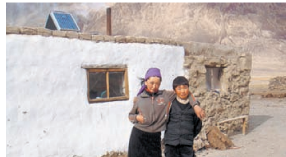
70 Prozent der Fläche Tadschikistans liegen im Hochgebirge, 50 Prozent liegen höher als 3000 Meter. Die Bevölkerung lebt in einfachsten Verhältnissen, ist aber Reisenden gegenüber äusserst gastfreundlich.