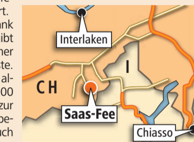
Grafik: Janina Noser